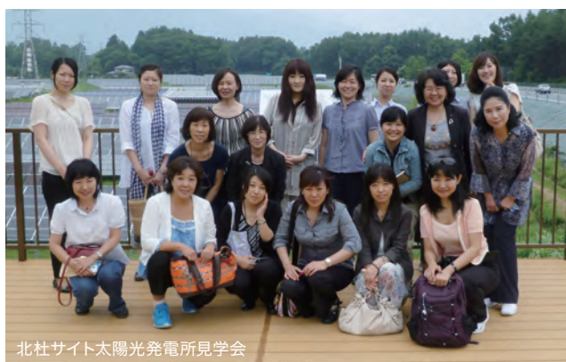
北社サイト太陽光発電所見学会

(一社) 東京都産業廃棄物協会・女性部『e-Lady21』は産業廃棄物処理業に携わる女性たちが集い、学び、意見を交換しながら様々な活動を行っています。